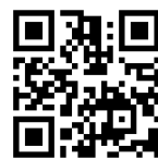
ソウファクトリーHP