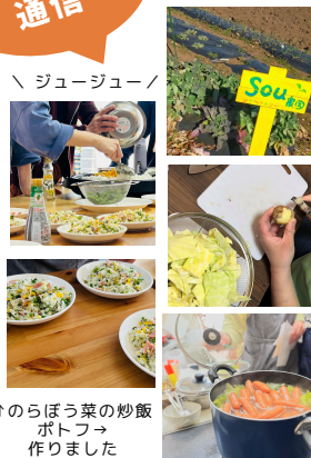
↑のらぼう菜の炒飯ポトフを作りました