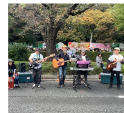
雨のち晴れの 大学通りのホコ天ライブ！